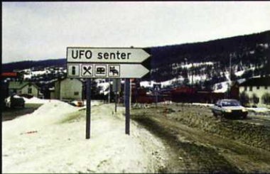
A small valley in Norway with many sightings of «strange lights». Norsk ufo-senter, Alen.