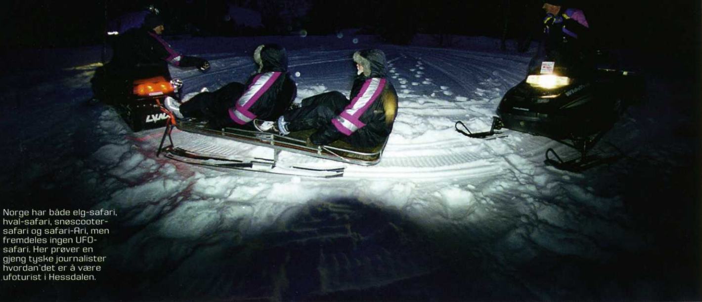
Norge har både elg-safari, hval-safari, snøscooter-safari og safari-Ari, men fremdeles ingen UFO-safari. Her prøver en gjeng tyske journalister hvordan det er å være ufoturist i Hessdalen.

ender. Andre har sett store, runde, røde lyskuler, og atter andre har sett lysende sigarer forsvinne opp i verdensrommet. Og noen har bare sett lyset.