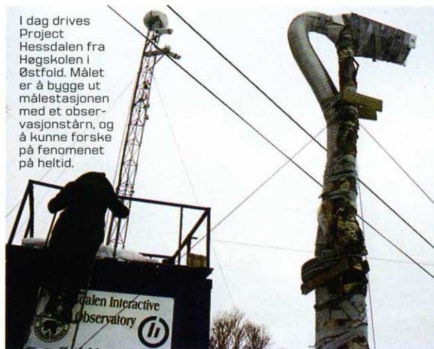
I dag drives Project Hessdalen fra Høgskolen i Østfold. Målet er å bygge ut målestasjonen med et observasjonstårn, og å kunne forske på fenomenet på heltid.

Les mer om Hessdalsfenomenet på: www.hessdalen.org (Project Hessdalen) www.nufos.no (Norsk ufo-senter)